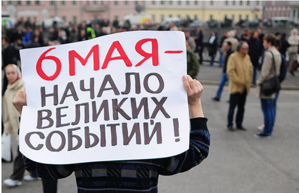
Митингующий на Болотной площади, 6 мая 2013 года