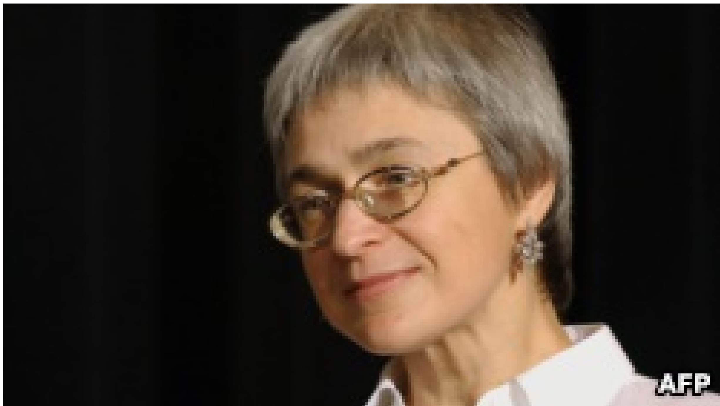
Анна Политковская, 16 октября 2002